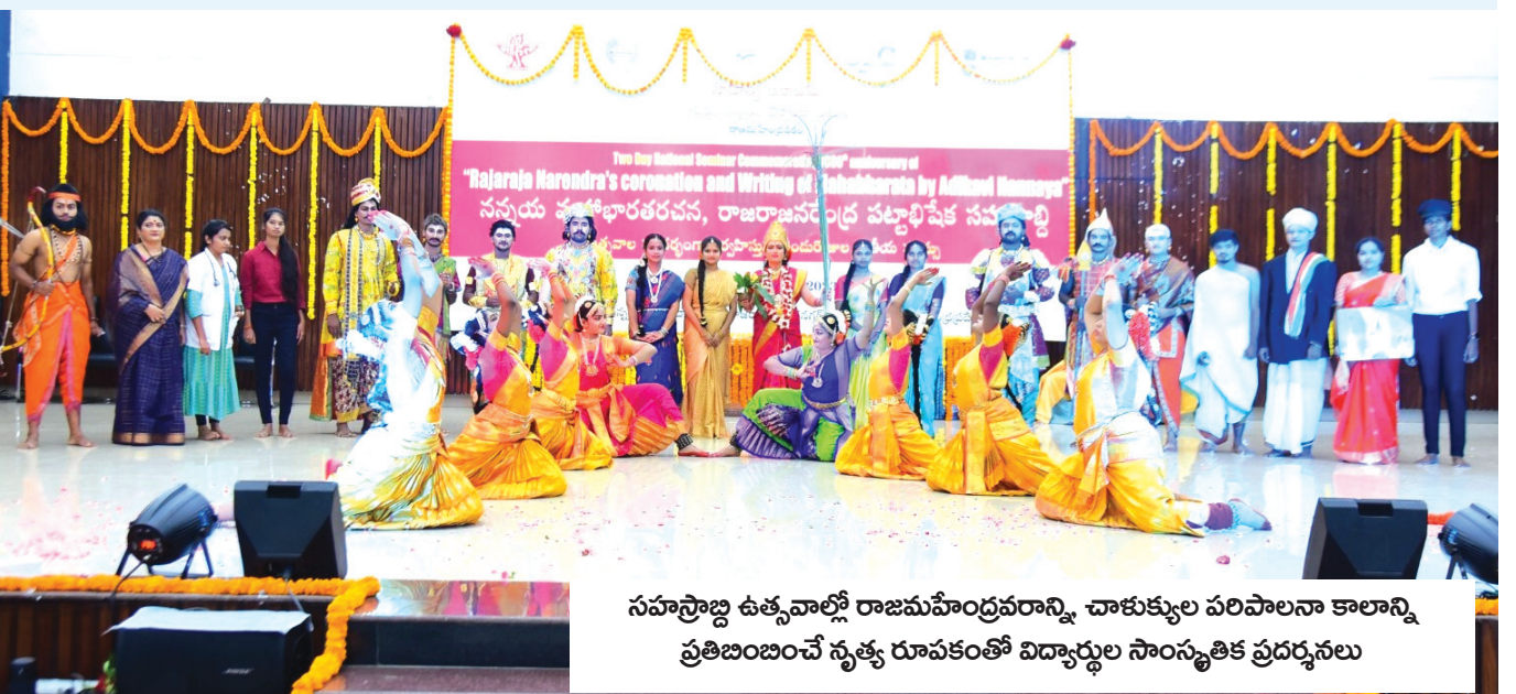
సహస్రాబ్ది ఉత్సవాల్లో రాజమహేంద్రవరం, చాళుక్యుల పరిపాలనా కాలాన్ని ప్రతిబంబించే నృత్య రూపకంతో విద్యార్థుల సాంస్కృతిక ప్రదర్శనలు