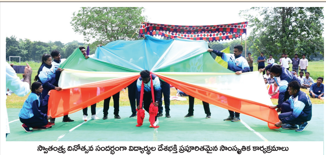
స్వాతంత్ర్య దినోత్సవం సందర్భంగా విద్యార్థుల దేశభక్తి ప్రపూరితమైన సాంస్కృతిక కార్యక్రమాలు